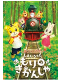
しまじろう

会館特別価格3,480円(全席指定) 3歳以上有料。3歳未満は保護者1名につきお父さま1名まで路上無料(席が必要な場合は有料)。