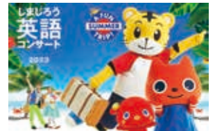
しまじろう

会館特別価格3,480円※特典シール付き(シールは公演当日、RaiBoC Hall 4階窓口にてお渡しします)(全席指定) 3歳以上有料。3歳未満は保護者1名につきお父さま1名まで路上無料(席が必要な場合は有料)。