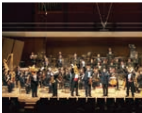
ズーラシアンブラス-新日本フィルハーモニー交響楽団CK.Watanabe

SaCLA 友の会会費 一般3,000円 子ども(3歳~高校生)1,500円 ひざ上親子席3,500円