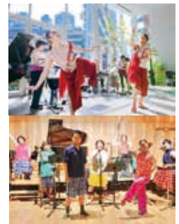
どうぶつおんがくたい

大人500円 小学生以下300円(全席指定) 0歳から入場可 2歳以下路上鑑賞無料(但し、席が必要な場合は有料)