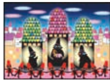
すてきな3にんぐみ