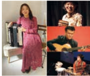
熊坂路得子withウタウアシブエトリオ