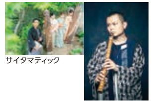
サイタマティック

「埼玉を和楽器で盛り上げたい!」をテーマに活動する和楽器カルテットサイタマティックが、和楽器バンドの尺八奏者神永大輔をゲストにコンサートを行います。