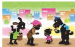
つのだえのうた第59集