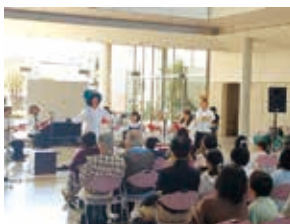
※11月3日の朗読劇の様子

一般1,500円 18歳以下1,000円 小学生500円(全席自由) 未就学児不可