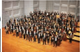
東京フィルハーモニー交響楽団

SaCLa 友の会 友の会料金 S席4,500円 A席3,500円 B席2,500円