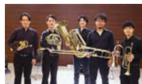
JMB Brass Quintet

SaCLaアーツ登録アーティスト「JMB Brass Quintet」による金管五重奏コンサートをお楽しみください。