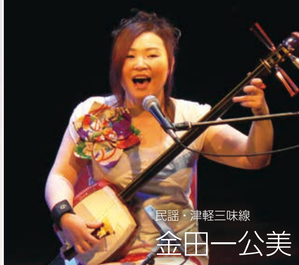
民謡・津軽三味線