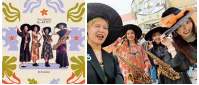
Wizard Saxophone Quartet(ウィザードサクソフォーンカルテット)