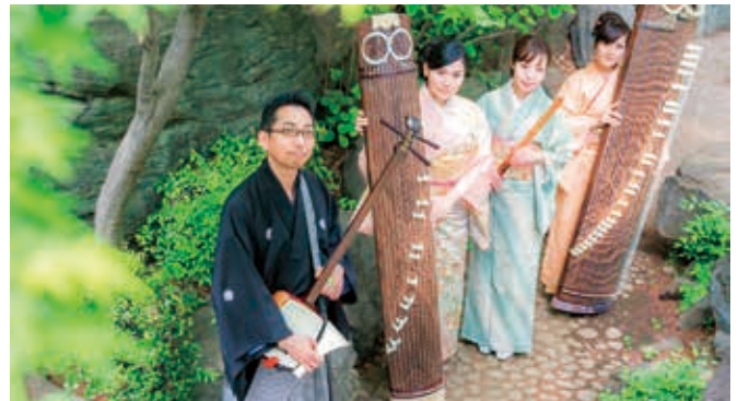
和楽器カルテット サイトマティック

「和楽器で埼玉愛」を合言葉に埼玉県全市町村ツアー展開中！オリジナル曲や親しみやすい音楽を軽快なトークと共にお届けします！