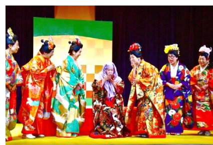
(右2枚は劇団レインボウ城! Twitterより)