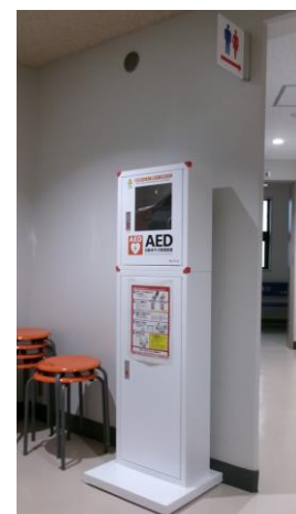
2階 トイレ♿側 AED