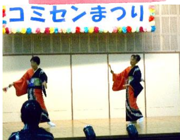
江戸端唄 姫と亀の会 (端唄・民謡の三味線)