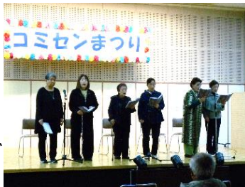
輝聴吟詠会・岩槻(詩吟)