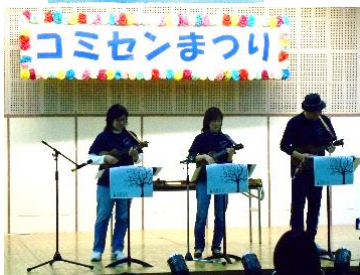
ゆるレレ(ウクレレアンサンブル)