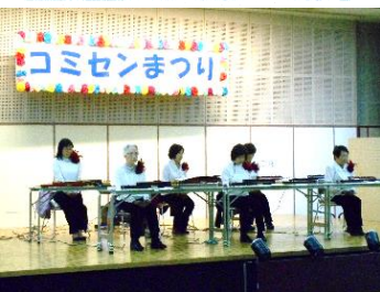
ひとみ会(大正琴演奏)

2024年11月23日・24日、2日間にわたり発表の部が開催されました。 たくさんの皆さまにご来場いただき、とても賑やかなまつりとなりました。