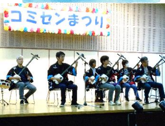
宮原ベベン会 (津軽三味線合奏)