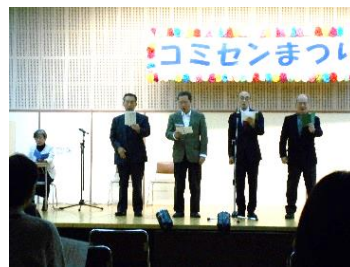
東武岳風会岩槻第一 ・第2教場(詩吟)