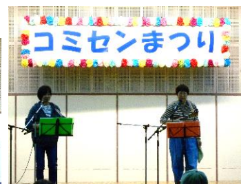
ケサランパサラン (ウクレレオリジナルソング弾き語り)