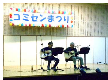
USIROMAEフォークソングクラブ (フォークソング演奏)