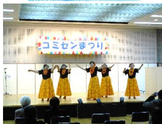
レイピカケ(フラダンス)