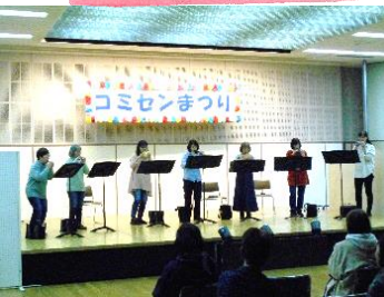
みっくす*ぶーけ (オカリナアンサンブル)