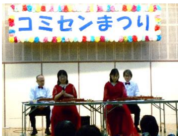
琴和会(大正琴演奏)