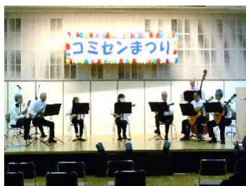
マンドリーノ・さくら (マンドリン合奏)