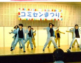
みなみクラブ (ジャズヒップホップダンス)