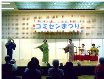
翔乃流 藤寿会(日本舞踊)