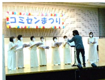
まざあぐうす(合唱)