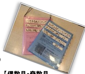
【偶数月・奇数月 となっております。】

正面玄関を入り 右側の【事業団関係】 ラックに掛けてあります。 各施設のコミセン便りですの で是非ご覧ください。