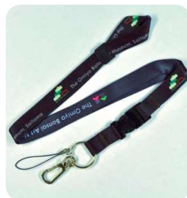
大宮盆栽美術館ミュージアムグッズ ネックストラップ(バックル付) 1,200円(税込)