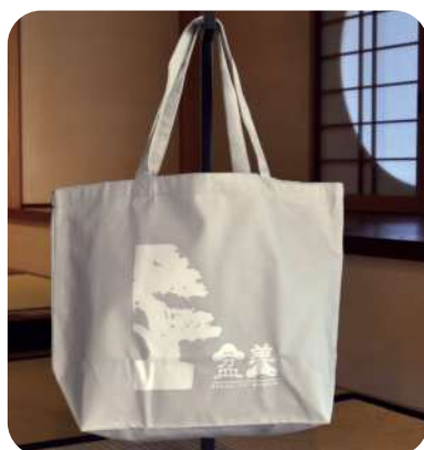
大宮盆栽美術館ミュージアムグッズ トートバッグ横型(46×32×14cm) 色:グレー→1,200円(税込) ※縦型色:紺もあります。(1,000円税込)