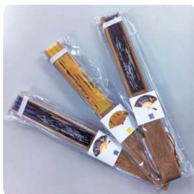
岩槻鷹狩りグッズ 扇子(青・黄・紫) 1,000円(税込)