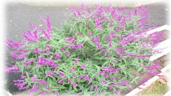
アメジストセージ

冬に突入しますが、アメジストセージはまだまだ盛り。 他の鉢は冬春用の植え替えのため、残った草木や根を取り除いて土を改良しています。